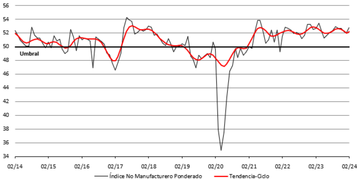
Gráfica 3: Indicador IMEF No Manufacturero y su tendencia-ciclo

A su interior hubo comportamientos diferenciados. Mientras que los componentes de Nuevos Pedidos y Empleo aumentaron 1.8 puntos y 0.6 puntos cada uno, cerrando en 55.4 y 51.3 unidades respectivamente, el de Entrega de productos se mantuvo sin cambio en 51.9 unidades. Por el contrario, Producción disminuyó (-)0.1 puntos, registrando un nivel de 52.9 unidades. Al respecto, destaca que todos los componentes han permanecido en zona de expansión por un tiempo prolongado.